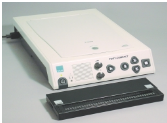
Der Poet Compact Braille