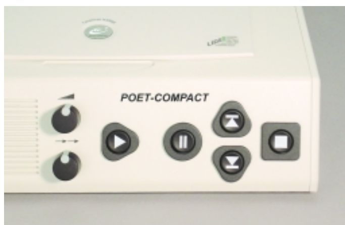
Übersichtliche und leicht verständliche Bedienknöpfe